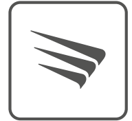
Image Ad – Beispiele